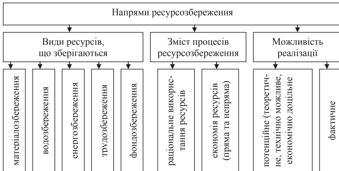
Рис. 2. Напрями та види ресурсозбереження

До організаційно-економічних заходів раціонального використання природних ресурсів відносяться: