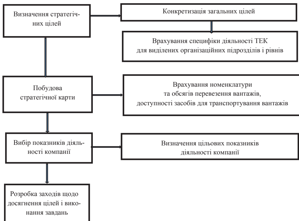
Рис. 1. Процес розробки і впровадження ЗСП в діяльність ТЕК

Для ТЕК рекомендовано виконувати традиційну послідовність з розробки і впровадженні ЗСП, враховуючи специфіку діяльності ТЕК (рис. 1).