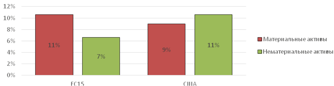
Рис. 2. Стоимость материальных и нематериальных активов в США и ЕС, среднее значение, 1995–2010 гг., % к ВВП

Образно суть американской стратегии может быть выражена известной русской сказкой – есть в море-океане остров, на нем сундук, в сундуке утка, в утке яйцо, в яйце игла. И вот если уткой и яйцом можно поделиться, то игла, в которой вся сила, должна быть ваша и только ваша. Как зримый результат воплощения такой стратегии США являются единственной страной в мире, где инвестиции в нематериальные активы больше инвестиций в материальные активы, а стоимость нематериальных активов больше стоимости материальных. Причем такая ситуация сложилась уже два десятилетия назад (!).